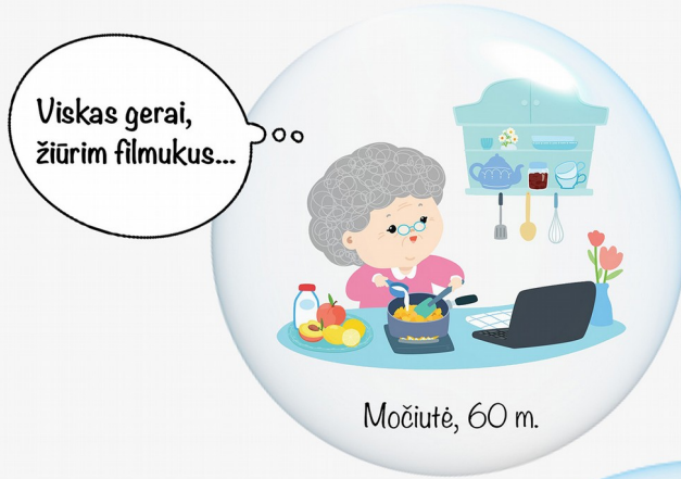
Močiutė, 60 m.