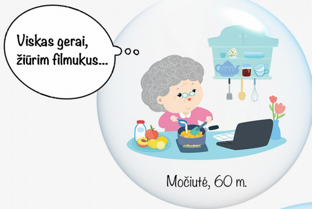
Močiutė, 60 m.